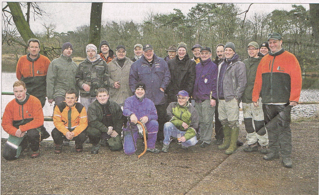
Mit vereinten Kräften: Mitglieder von Bürgerverein, Angelverein und Forstamt packten mit an.