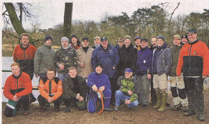
■ Mit vereinten Kräften pflegten der Bürgerverein Wahn-Wahnheide-Lind und weitere Freiwillige die Wege rund um den Scheuermühlenteich.

Der Vorstand des Bürgervereins lud jetzt den Angelverein AFG Porz Süd und das zuständige Forstamt zu einer Pflegeaktion ein. Mit vereinten Kräften wurden überhängende Zweige und Äste zurückgeschnitten und die Uferbefestigungen erneuert. Trotz wöchentlicher Leerung der Abfallbehälter, sammelt sich außerhalb der Wege leider immer wieder Müll an. So schlugen sich alle Helfer in die Büsche und sammelten fleißig Müll ein. Der Vorstand des